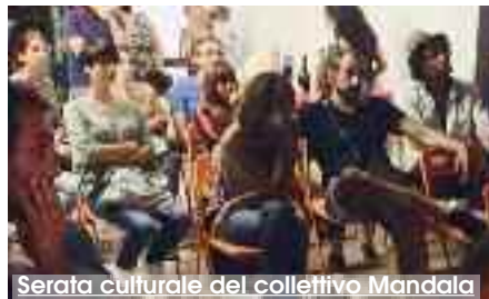
Serata culturale del collettivo Mandala

Domani con inizio alle ore 18.00, presso i locali del Collettivo Mandala in Piazza Generale Scio a Trapani, l'associazione UP in collaborazione con il Collettivo Mandala presenterà l'ultima tappa di "Rotte indipendenti". Un ciclo di quattro documentari che raccontano la nascita della scena musicale indipendente in Italia attraverso la proiezione di video, concerti e testimonianze di chi ha vissuto quegli anni in prima persona. Rotte Indipendenti è un viaggio che conduce il pubblico in quelli che sono stati i luoghi propulsori della cultura musicale italiana: Bologna, Milano, Roma e Torino. La quarta tappa è la capitale romana. UP nasce dall'esigenza di creare una condivisione culturale e musicale nel contesto di Trapani, proponendo delle iniziative che consentono la divulgazione della cultura anche ai di fuori dei centri didattici. È inoltre occasione di confronto e socializzazione in un contesto creato da giovani e per i giovani, in uno spazio, quello del collettivo Mandala che nasce dall'idea di «volare oltre il quotidiano e poter realizzare un sogno». (M.P.)