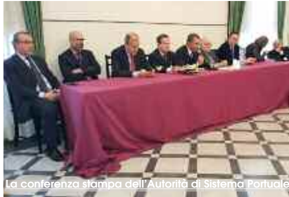
La conferenza stampa dell'Autorità di Sistema Portuale

Trapani avrà anche un ufficio decentrato della Autorità di sistema con sei addetti; Porto Empedocle con tre addetti. Monti ha anche sottolineato le difficoltà di operare in interventi radicali nei porti di Trapani e Porto Empedocle in assenza di uno strumento regolatore. Il piano regolatore del porto di Trapani è del 1962, quello di Porto Empedocle del 1968. L'unico strumento per operare nel porto è quello dell'adeguamento tecnico funzionale che deve essere definito con il Consiglio Superiore delle Opere Pubbliche, presidente Massimo Sessa, e da questo autorizzato. Nelle more della redazione del piano regolatore del porto l'Autorità di Sistema sta pianificando la possibilità di condividere la programmazione urbanistica con il Comune di Trapani, che si accinge ad una revisione del PRG della città. Già il prossimo 23 gennaio ci sarà al Comune di Trapani una riunione congiunta tra i tecnici comunali e