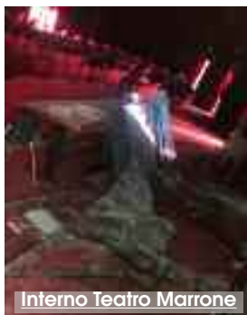
Interno Teatro Marrone