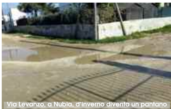
Via Levanzo, a Nubia, d'inverno diventa un pantano

I residenti della via Levanzo, a Nubia, frazione del comune di Paceco, lamentano la mancanza di un adeguato manto stradale. L'assenza dell'asfalto rende invivibile una zona residenziale. Con le piogge la via Levanzo accumula acqua e si trasforma in una sorta di lago, impraticabile dai pedoni e con il rischio di rimanere impantanati nelle pozzanghere. In estate le strade si asciugano e la via Levanzo, a causa dei venti di scirocco, diventa un caos di polveri, «che - spiega l'idrologo Giacalone a nome degli abitanti della zona - respiriamo, ci entrano nelle narici e in gola e ci costringono a stare con le finestre chiuse». Nella via Levanzo vivono 30 famiglie che da anni pressano il Comune di