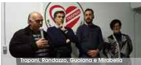
Trapani, Randazzo, Guaiana e Mirabella

"Dopo quello che è successo a maggio, con le elezioni annullate per motivi personali, e dopo quello che è successo alle Regionali con lo sgarbo al territorio